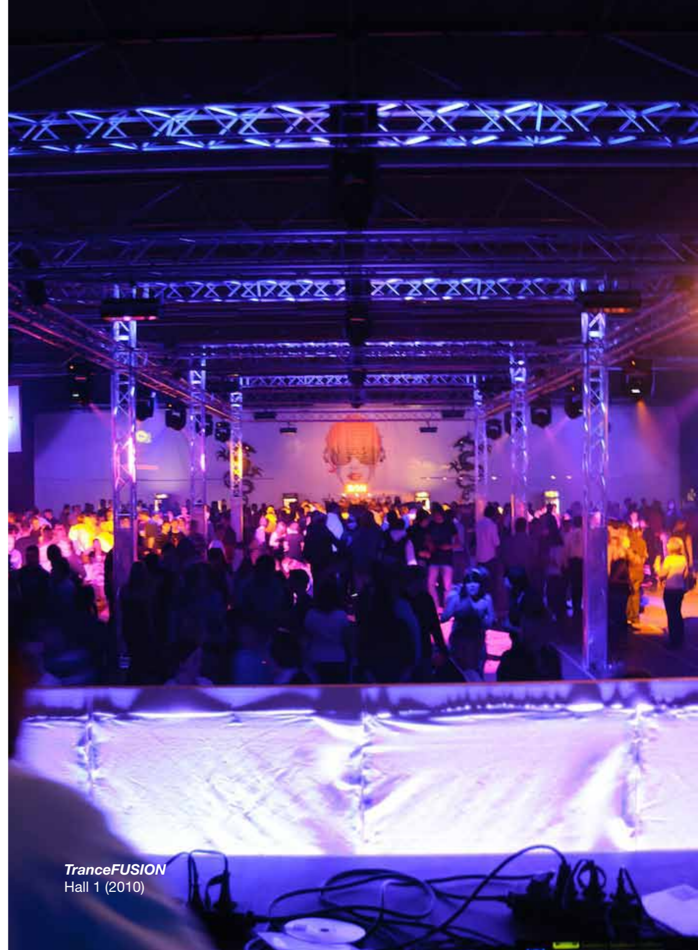
TranceFUSION Hall 1 (2010)

Op www.trancefusion kan je terecht voor alle nuttige meer informatie, normal- en vip-tickets, wedstrijden en vele extra's. (TF)